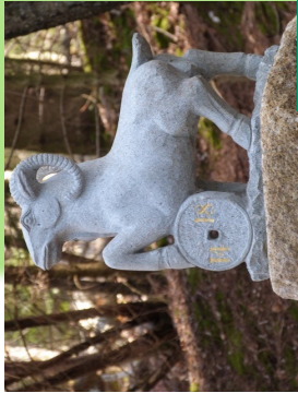
Stèle des Corses