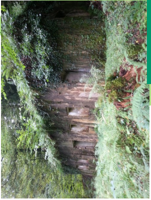
Vestiges de l'infirmerie de Thiaville